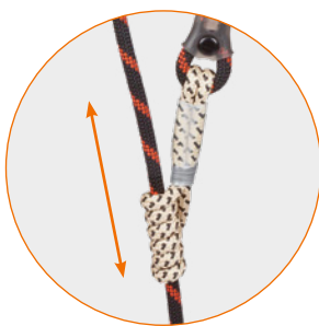
Textiler Klemmknoten als Auffanggerät: Blockiert in beide Richtungen Textile knot as fall arrest device: stops in both directions